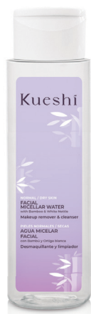
EAN. 8436568900971 FACIAL MICELLAR WATER 400ml

It is a refreshing, gentle and cleansing solution that gets rid of impurities, leaving it soft and hydrated. Indicated for all skin types. It does not need to be removed.