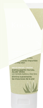
EAN. 8436568905129 ALOE VERA FACIAL SCRUB 85ml

Gotu Kola + Chamomile Centella Asiática + Camomila